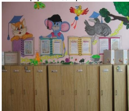
Информация для родителей