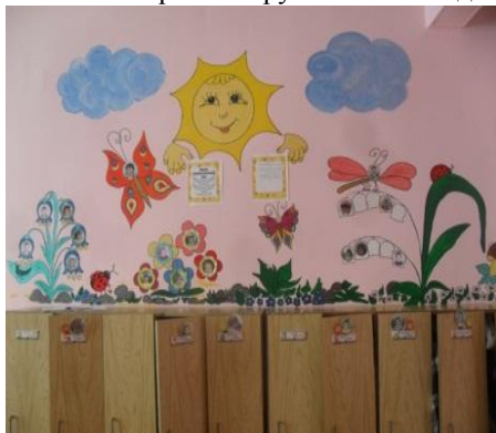
Визитная карточка группы «Непоседы»